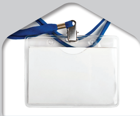
מנשא לתג גמיש שלם/חצי