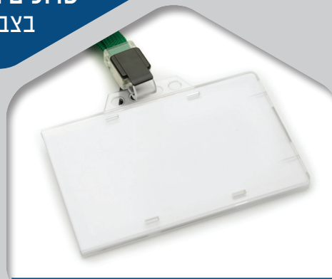
מנשא לתג קשיח סגור/פתוח