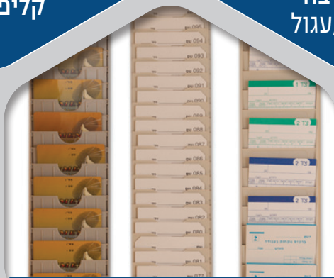
מעמדי פלסטיק לתגים