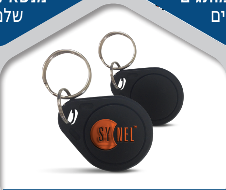
תגי קרבה משולש/עגול